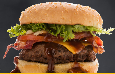
Burger BBQ au whisky

Tous nos burgers sont servis avec des frites et de la salade de chou